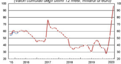
Fabbisogno delle Amministrazioni pubbliche (valori cumulati degli ultimi 12 mesi, miliardi di euro)

O quando le giovani generazioni chiederanno conto a chi ha messo sulle loro spalle un fardello così pesante come il debito pubblico italiano.